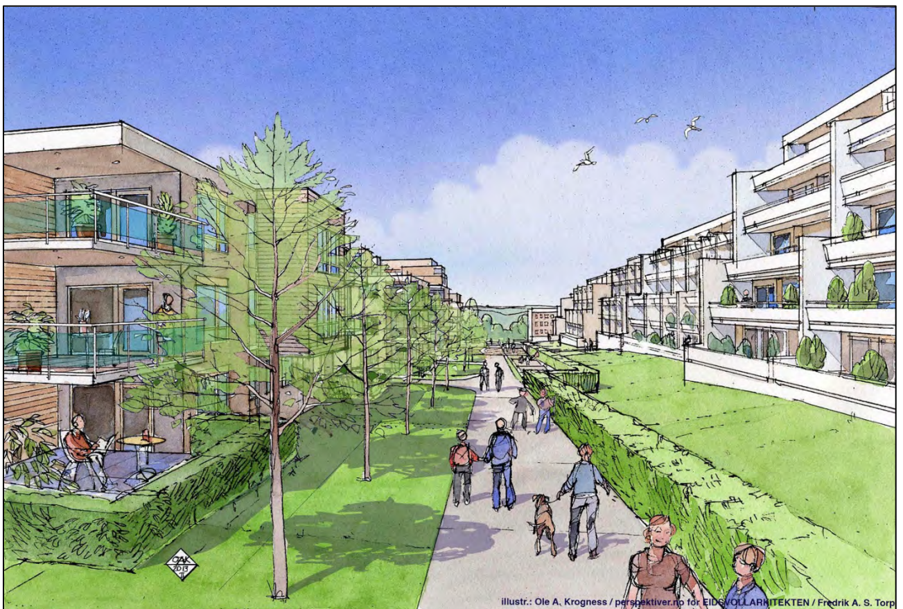
illustr.: Ole A. Krogness / perspektiv.no for EIDSVOLLARKITEKTEN / Fredrik A. S. Torp