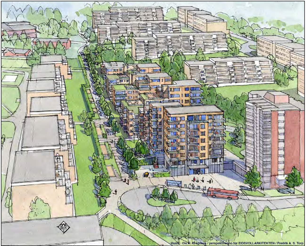
Illustr.: Ole A. Krogness / perspektiv.no for EIDSVOLLARKITEKTEN / Fredrik A. S. Torp